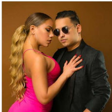
Lenin & Genesis